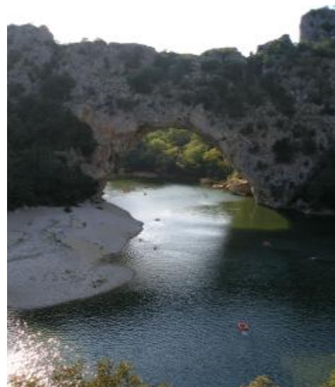
Pond du Arc

Další oblast, kterou bych Vám (pohodovým nenáročným lezcům, kteří lezou pro potěšení z lezení a krásných výhledů) chtěla doporučit je oblast Salavas. Je to asi 50 km od Balazucu. Cestou sem pojedete přes spoustu krásných městeček pořád podél řeky Ardeche, která se proplétá téměř celou touto oblastí a vytváří fakt krásná místa, na spoustě z nich se dá lézt.